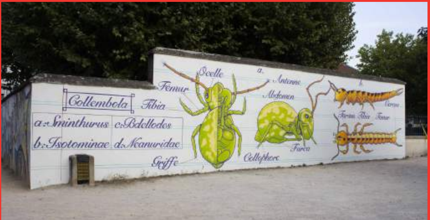
«Les collemboles» de Philibert à l'École Les Balmes. Rue Marguerite Tavel (Fontaine).