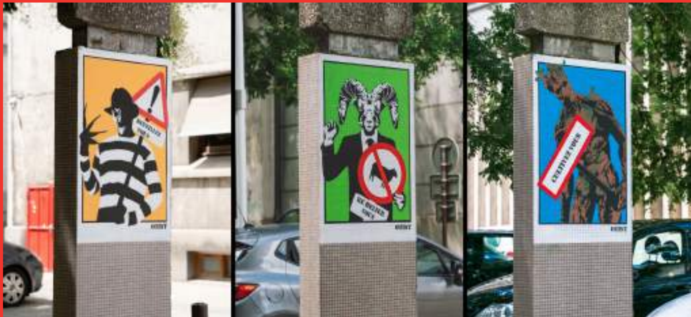
«Évolution» de OTIST au Parking Hoche - rue François Raoult, Grenoble.