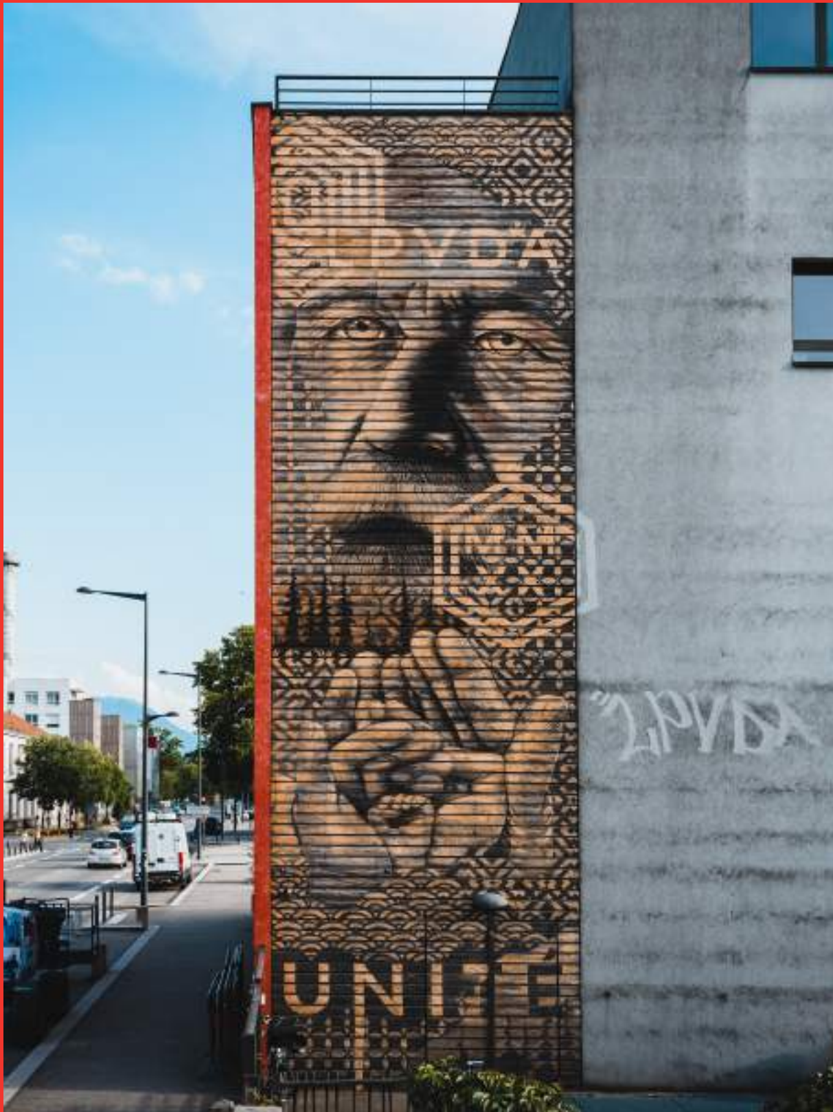
«Unité» de LPVDA sur la Façade Croix Rouge - 66 Avenue Rhin et Danube, Grenoble .