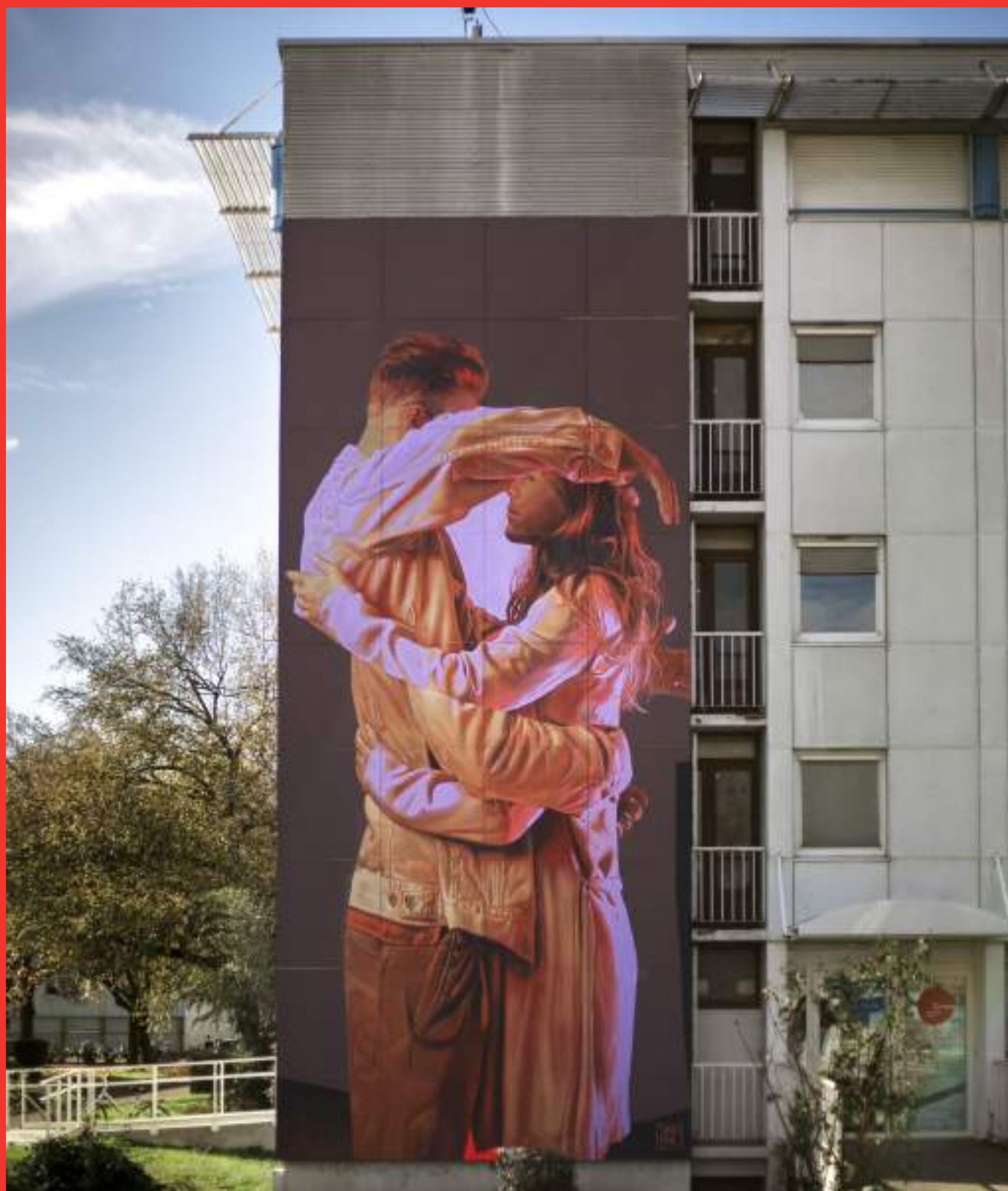
«The embrace» de Telmo & Miel | Résidence Crous au 107 rue des Taillées, Saint Martin d'Hères