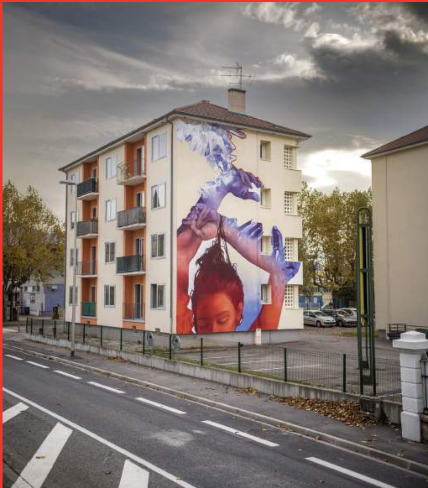
«Old Skin» de Iota au 5 avenue Raffin Caboise à Le-Pont-de-Claix