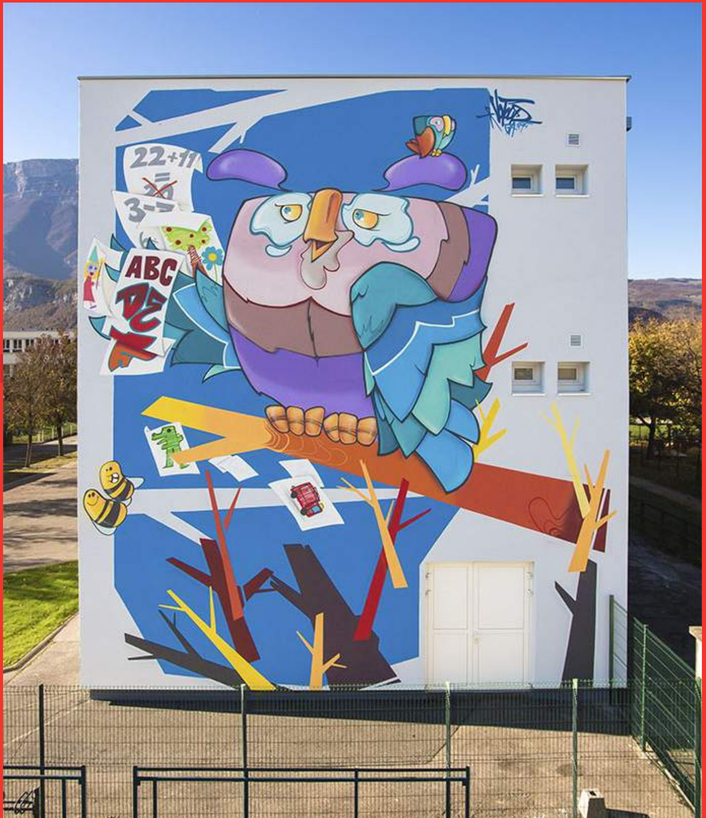
«Le maître décolle» de Votour à l'École Jean Moulin au 5 rue Dr. Valois, Le-Pont-de-Claix.