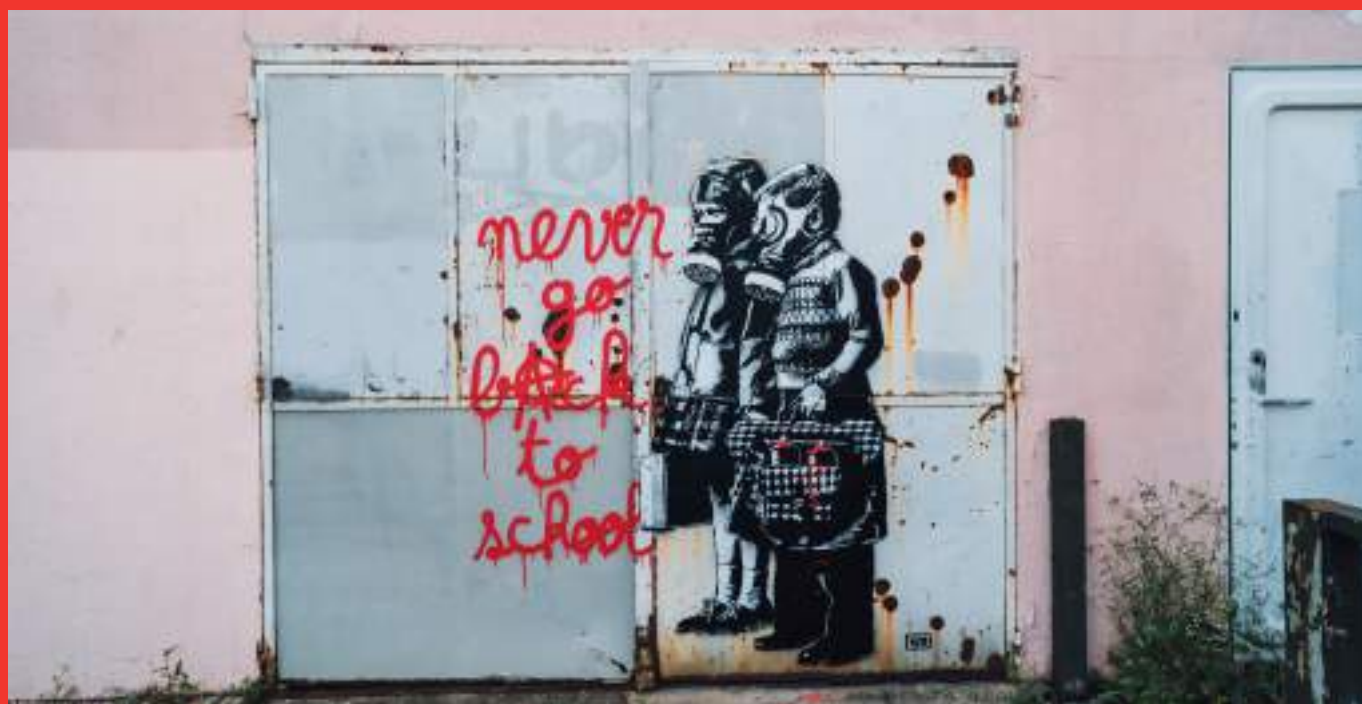
«Never go back to school» de GOIN au 5 Rue Roger Louis Lachat, Grenoble