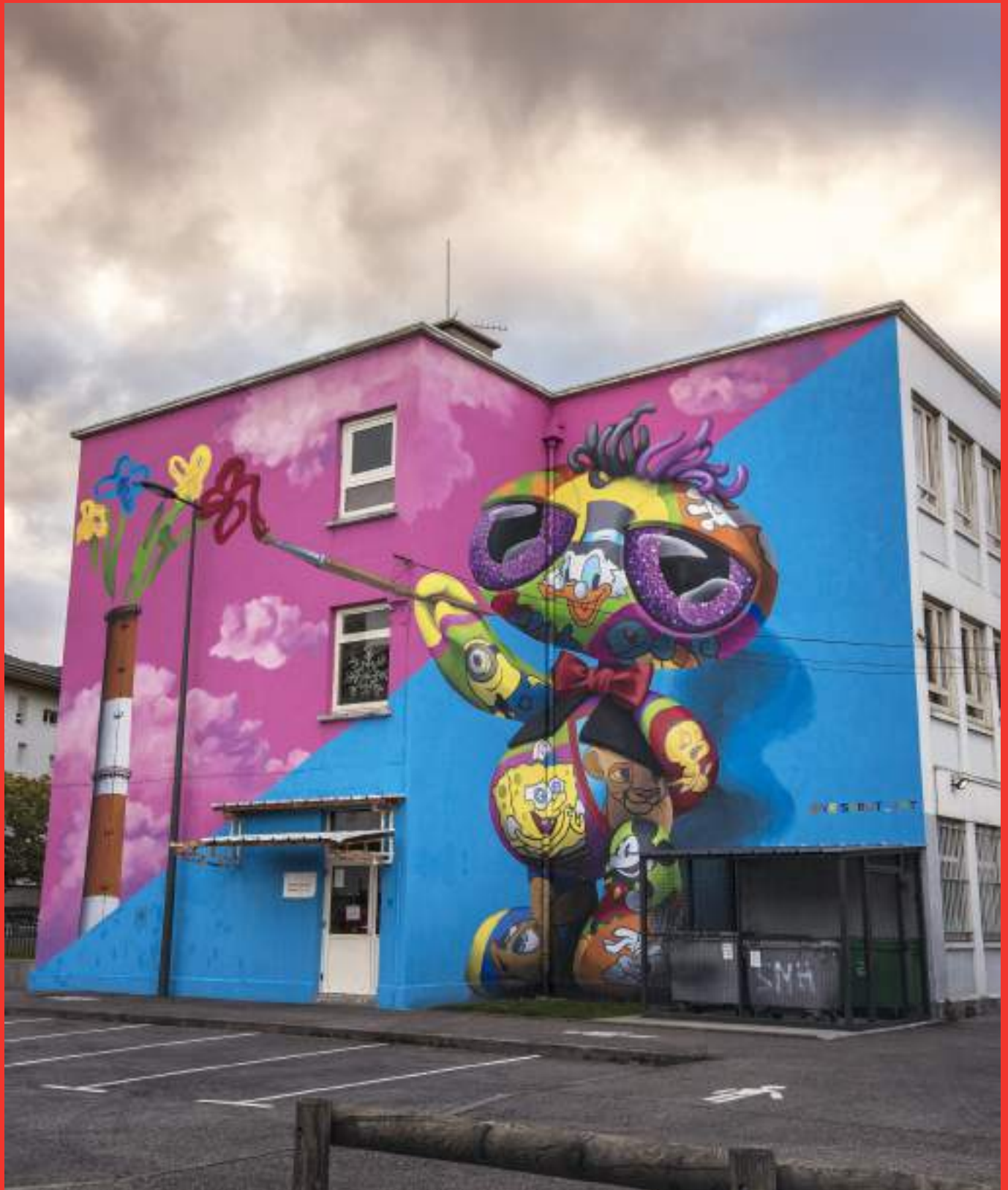
«Artist» de Viktorija Vesibrut à École Voltaire, rue Edmond Rostand, Saint Martin d'Hères.