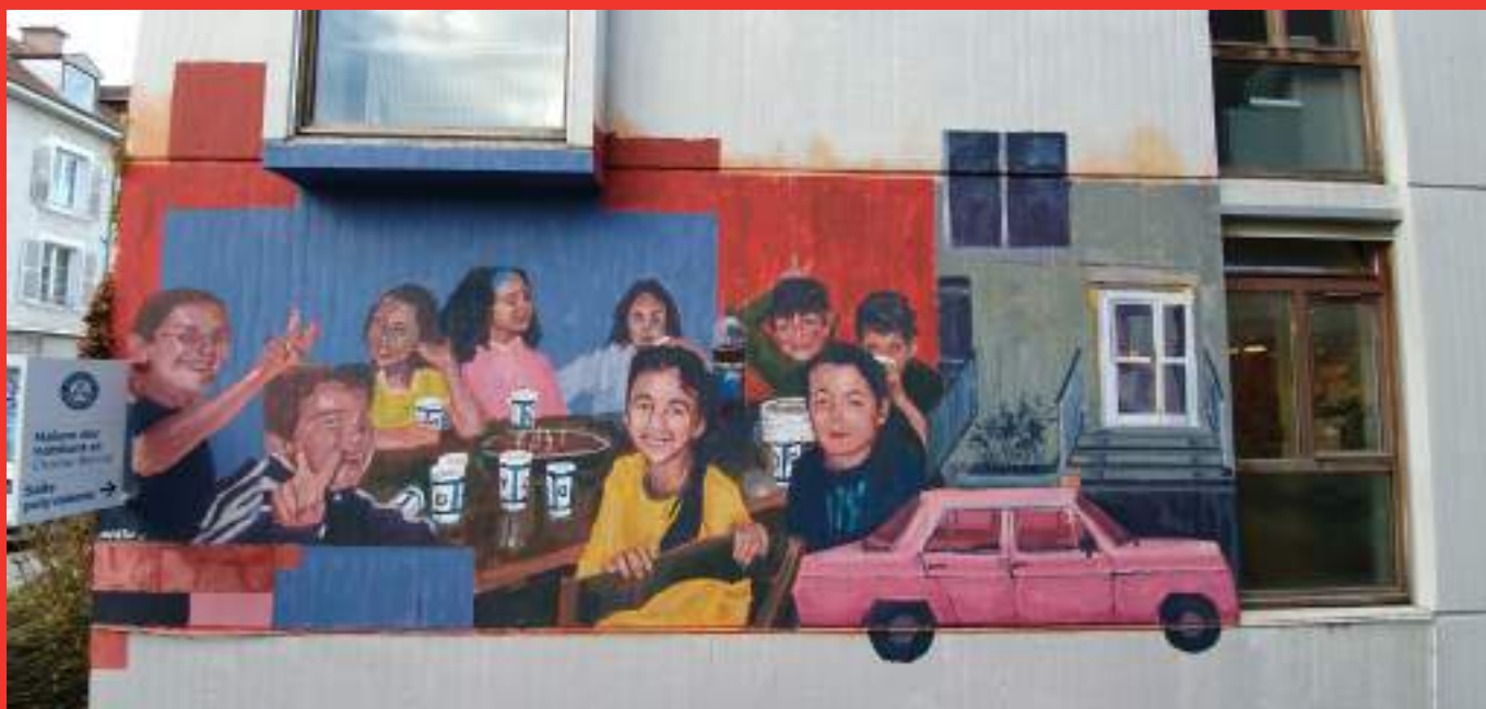
«Tous les voisins d'un autre» de Collectif Muz Mural Media sur le mur de la Maison des Habitants Chorrier - Berriat. 10 Rue Henri le Châtelier, Grenoble