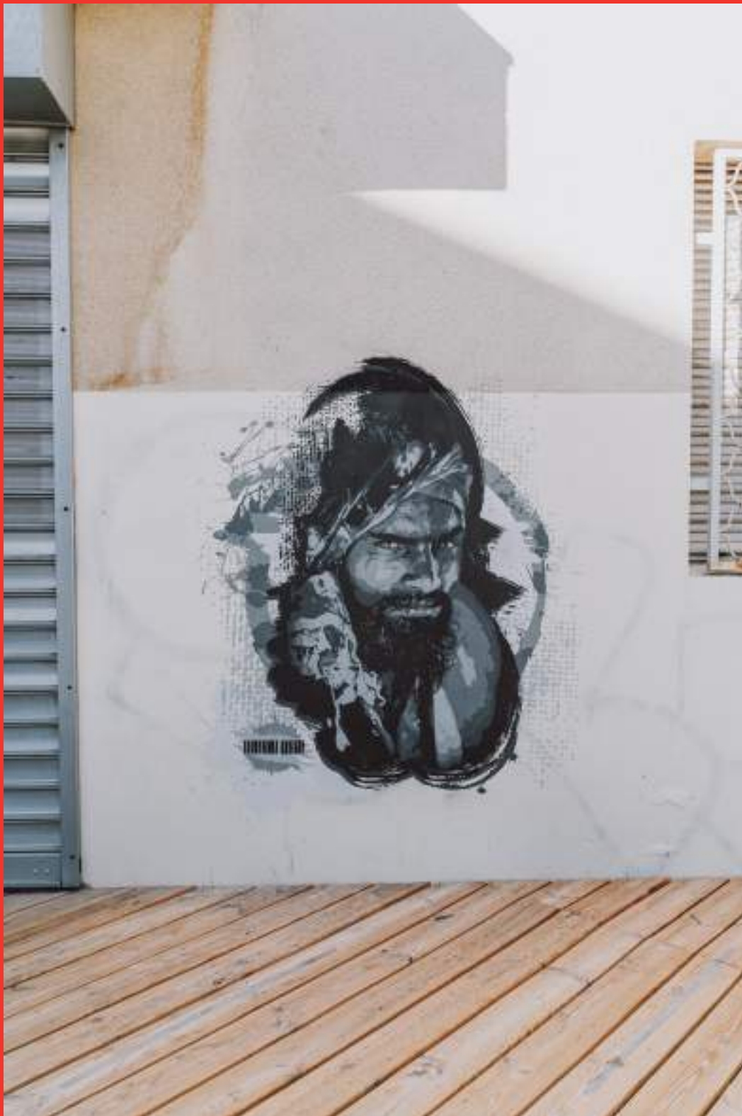
«L'inconnu de la gare de Jodhpur» de L'ENFANT LIBRE sur un des murs de la Médiathèque Paul Eluard à Fontaine