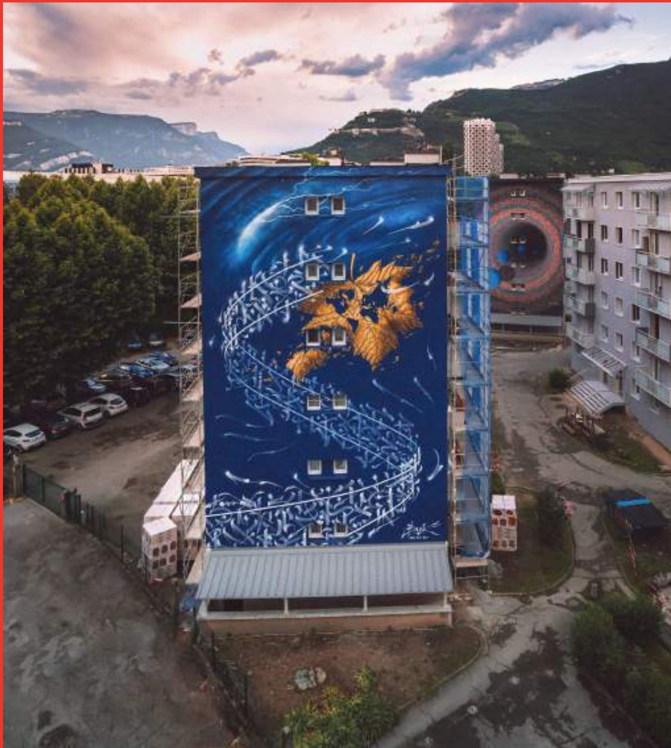
«Mise en garde» de Snek au n°20 Résidence Galieni, Boulevard Galliéni, Grenoble