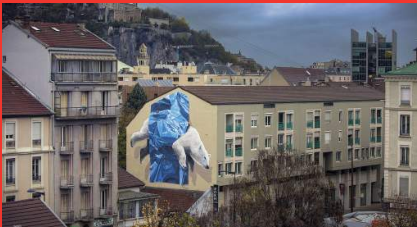
«Collapse» de Nevercrew au 122 Cours Berriat, Grenoble