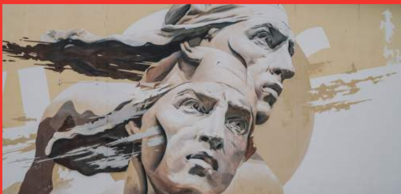
«L'union fait la force» de Piet Rodrigues au Gymnase Langevin - Façade côté rue Paul Langevin, Saint Martin d'Hères.