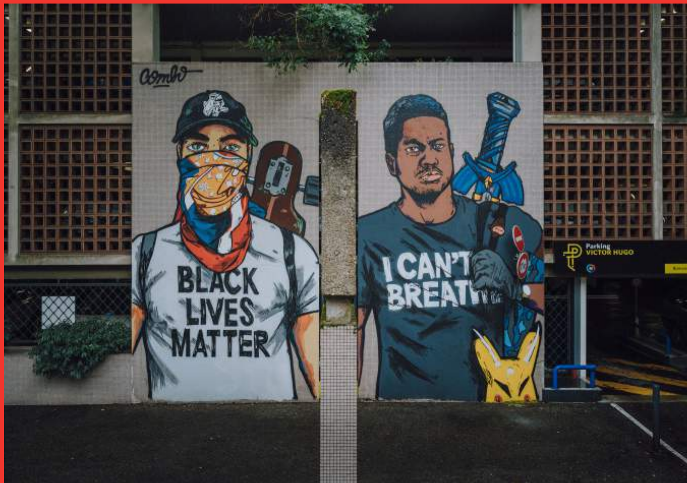
«Black lives matter» de COMBO au Parking Hoche - rue François Raoult., Grenoble.