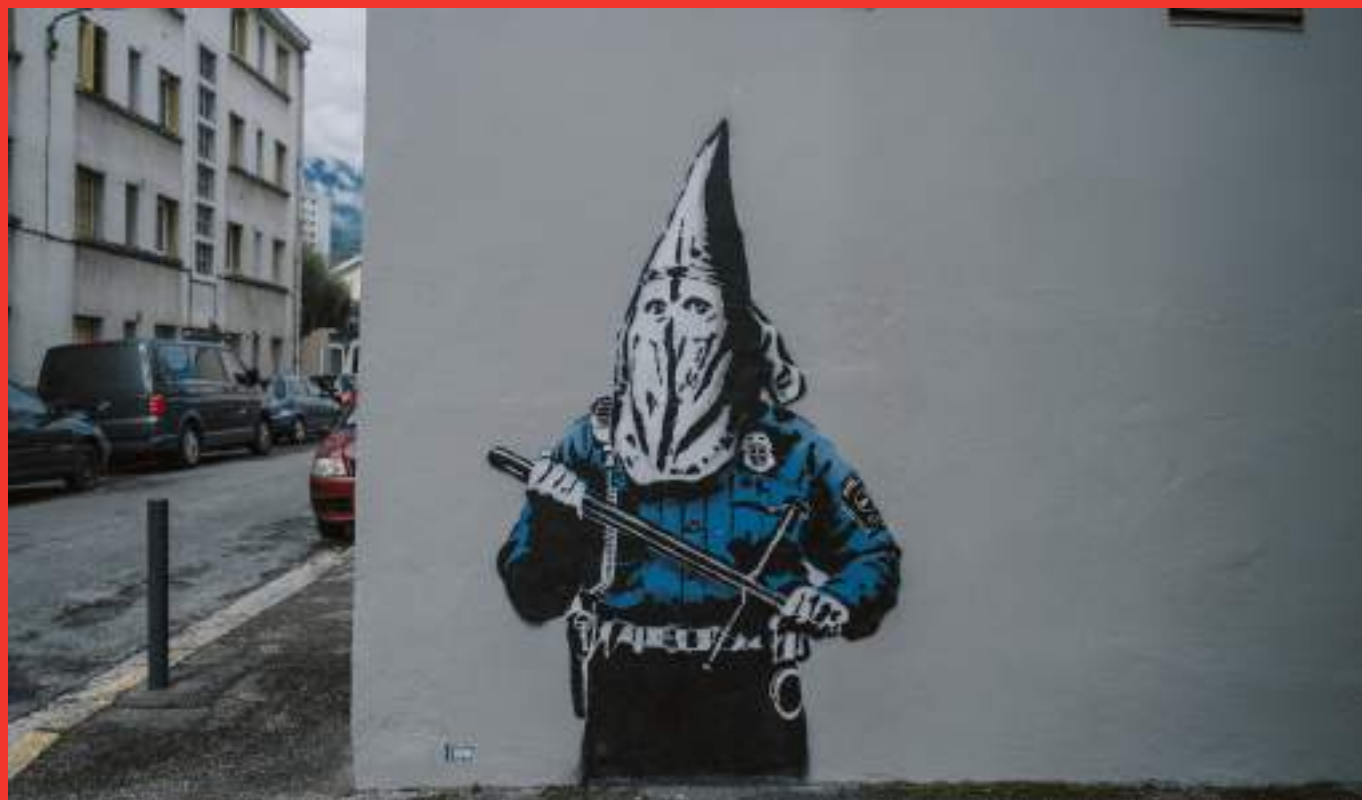
«KKKOPS» de GOIN au 2 rue Henri Bergson, Grenoble