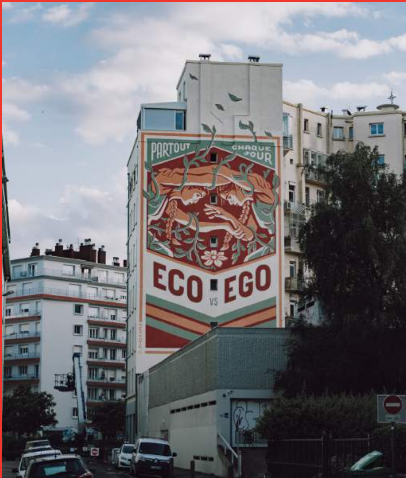
«Eco vs. Ego» de Reskate Arts & Crafts au 1 Place Doyen Gosse, Grenoble