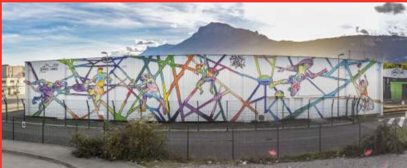
«Summer Gammes» de Srek & Will sur la façade du CEA, 17 Avenue des Martyrs, Grenoble