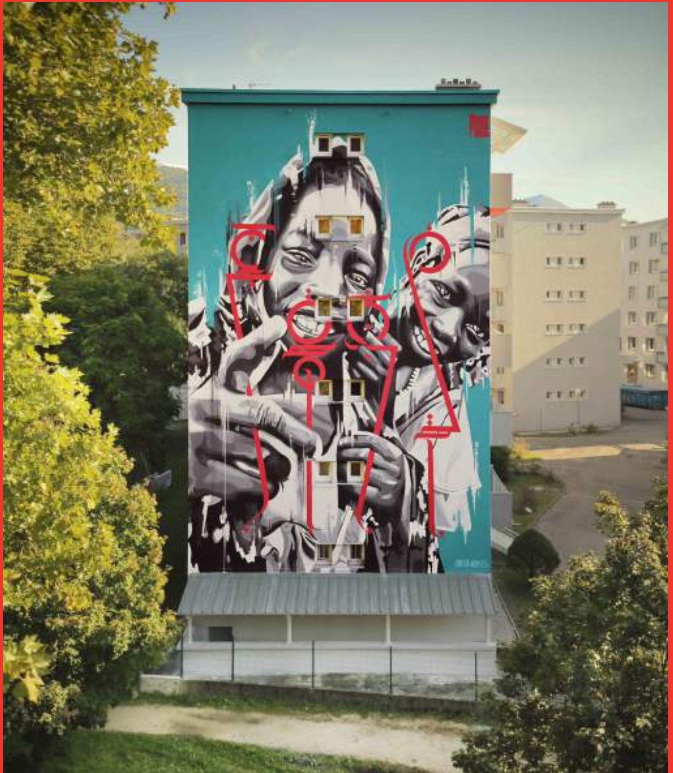
« I'm new here » de Yann Chatelin au 28 boulevard Galliéni (Résidence Galliéni). Grenoble