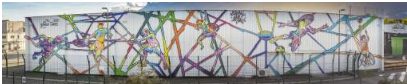
Summer Games 2021 de Srek & Killah One au CEA, Grenoble

Malgré la crise, la mise à disposition de murs par les entreprises s'est maintenue dans le cadre du Street Art Fest, avec les réalisations d'œuvres sur les bâtiments du CEA, d'ARaymond, d'Enedis et de la Croix Rouge.