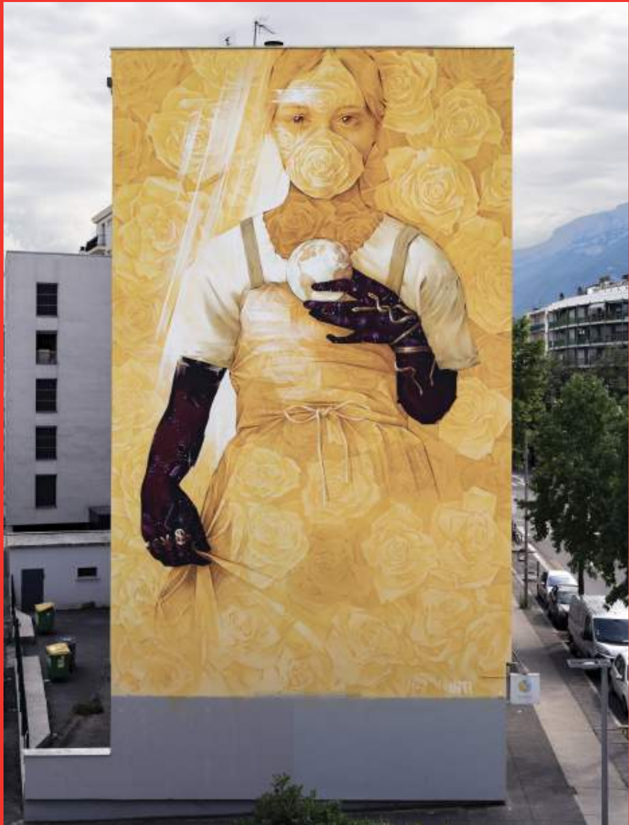
«A Pal Dot Blue» de INTI au 17 rue Jules Flandrin, Grenoble