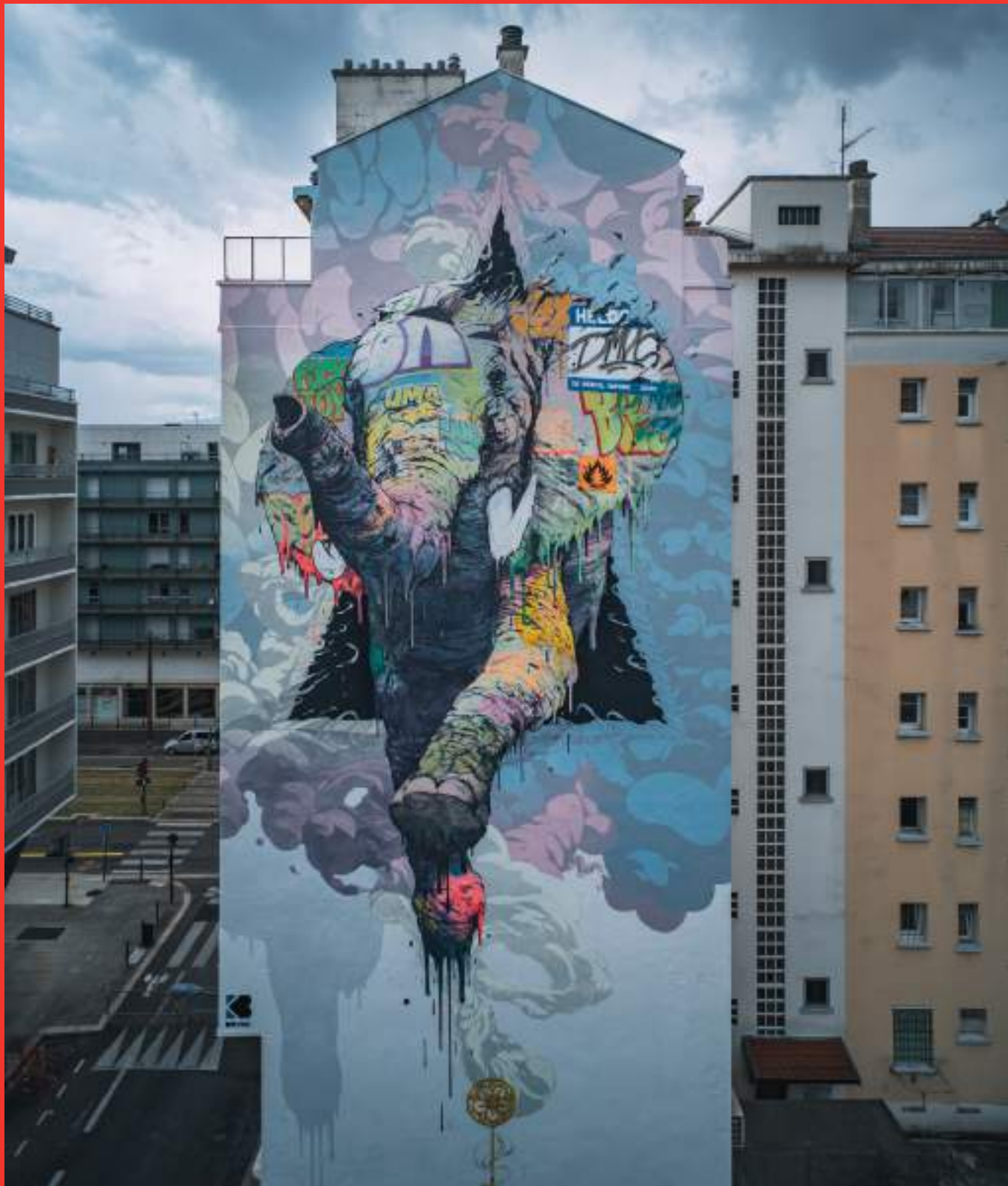
«Hannibal» de Brusk au 35 rue Mallifaud, Grenoble