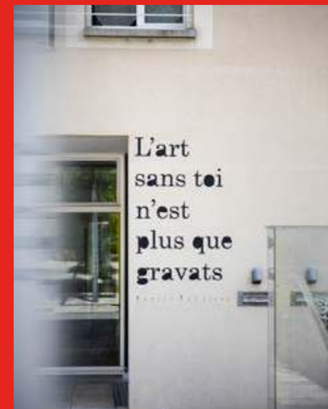
«L'art sans toi...» de Petite Poissone. Bibliothèque le verbe être au 28 Rue du Pont Prouiller, La Tronche.