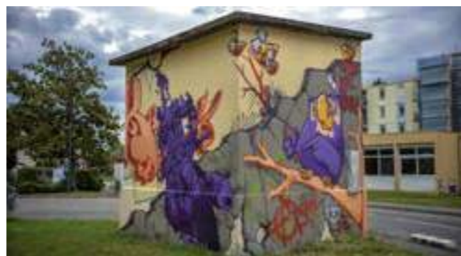
«No futur...ou pas» du Collectif Contratak au Poste Enedis. Place Karx, Saint Martin d'Hères