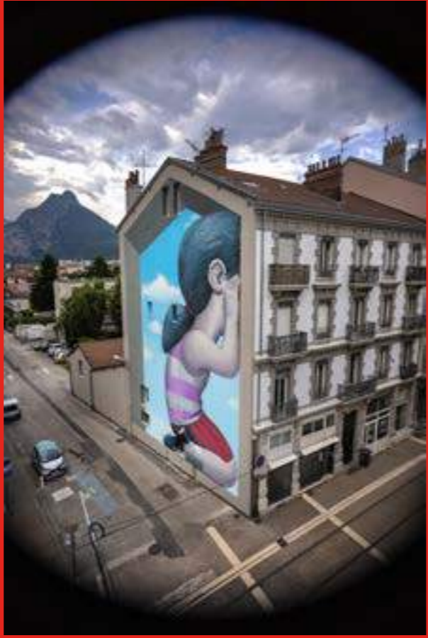
«Les yeux dans les yeux» de Seth au 11-14 Avenue Aristide Briand, Fontaine