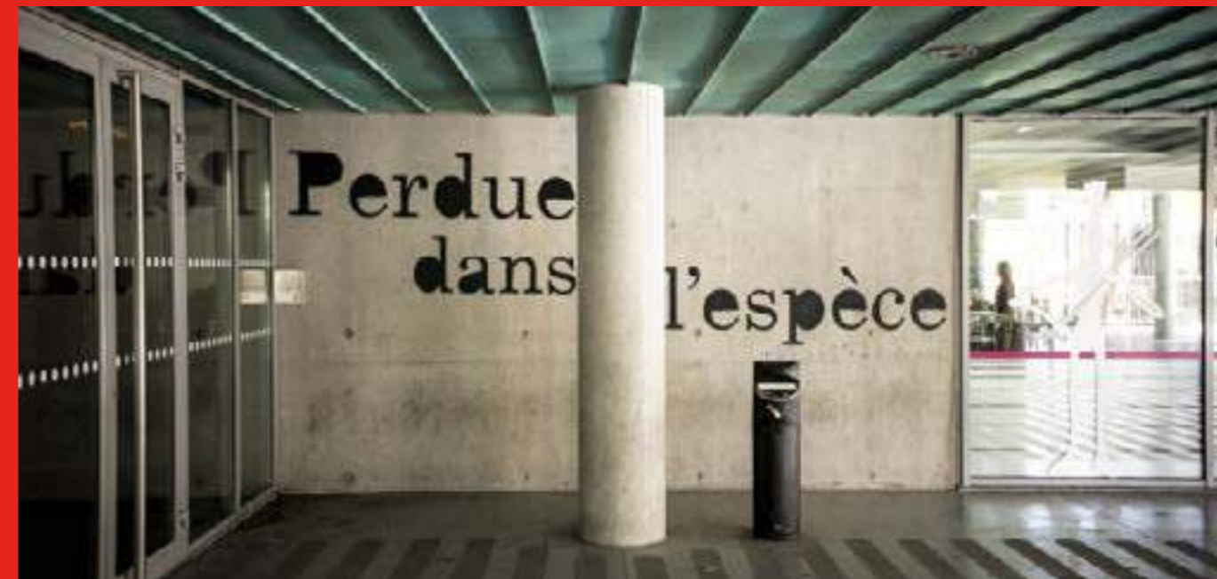
«Perdue dans l'espèce» de Petite Poissone. 89 au Avenue Jean Jaurès, Eybens