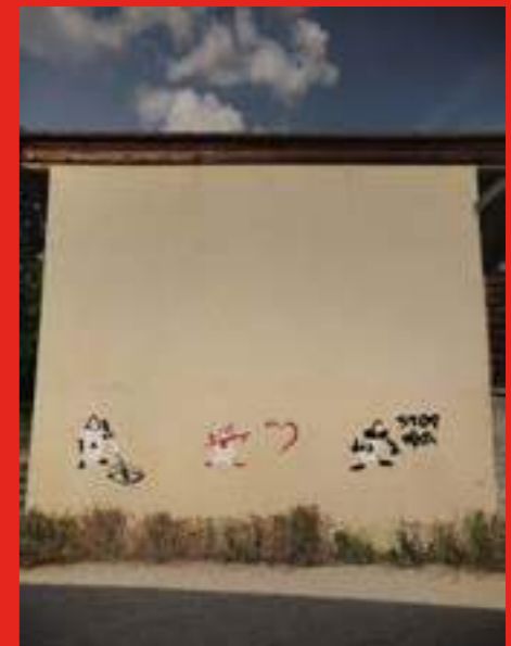
« Alice au Pays des Merveilles #3 » au rue de la Pallud, La Tronche