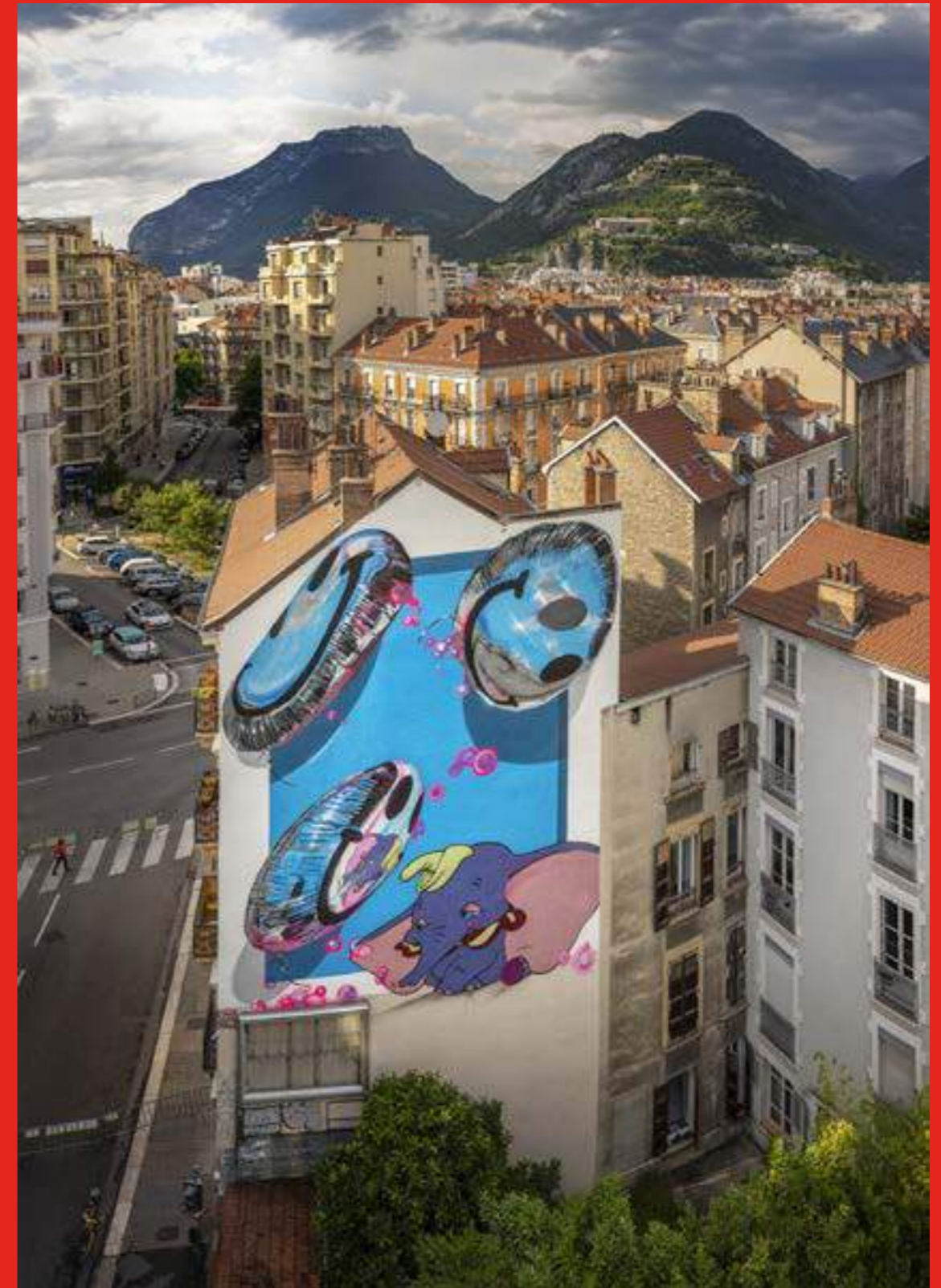
«Let's get trunk, Dumbo» de Fanakapan au 1 rue Marceau, Grenoble