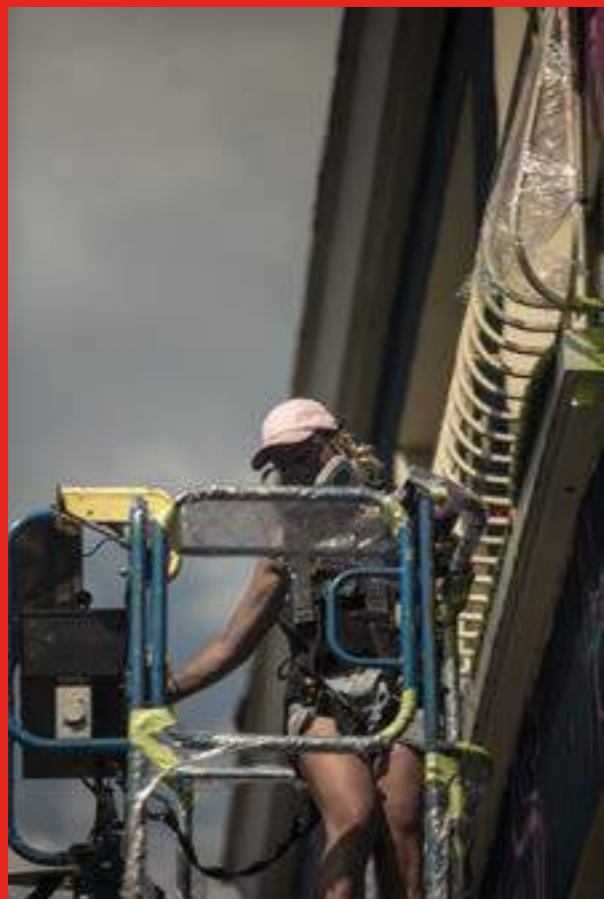
«Florish» de Sophie Mess au 4 Square Maison Neuves, Eybens