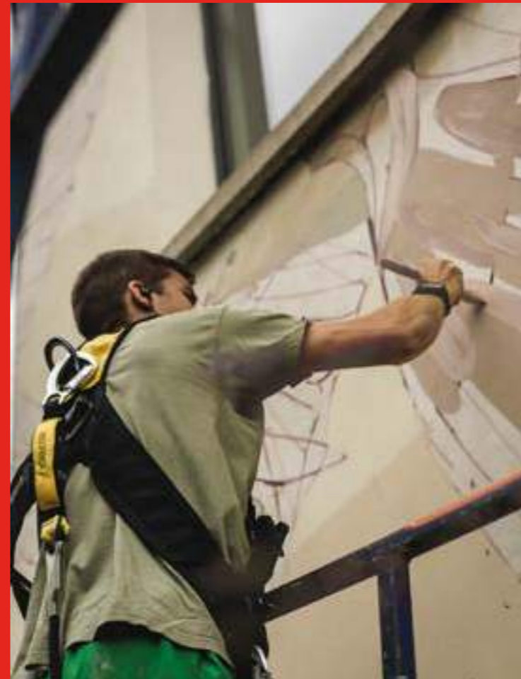
“Bearded vultures and some of the last blue sea hollies from the Alps» de Taquen. 11-13 rue Doyen Gosse, La Tronche