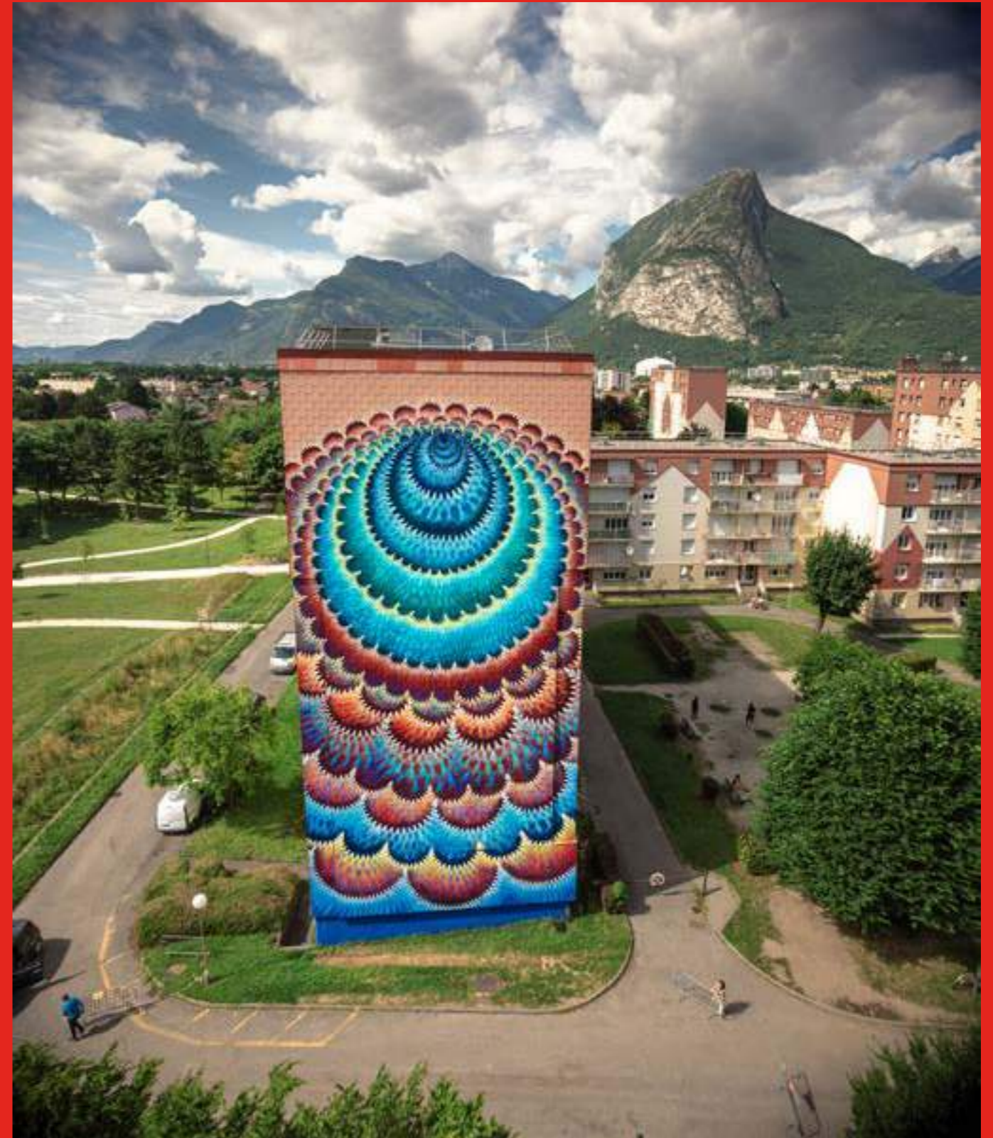
“Never Ending, forever Living” de Hoxxoh au 33bis Mail Marcel Cachin, Fontaine