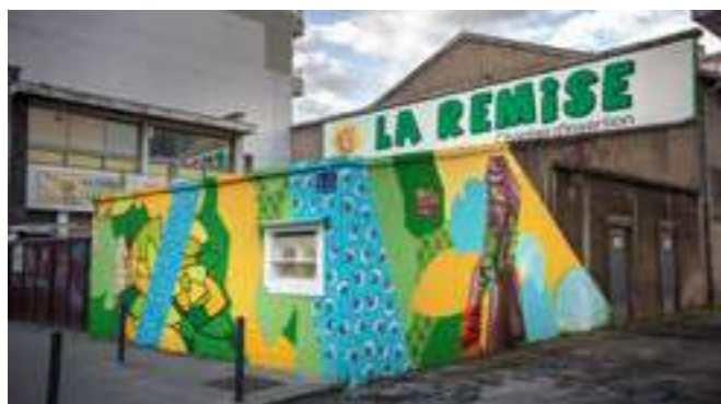
«Wax File» de Ekis & Boye. Façade de La Remise. 35 Rue Général Ferrié, Grenoble