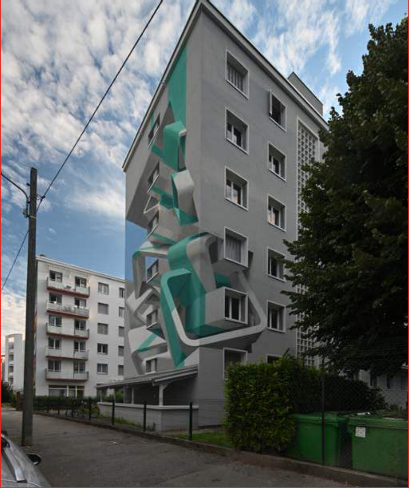
«Longitudinal architectural rearrangement 0015» de Peeta au 10 Résidence Galliéni. Boulevard Galliéni, Grenoble