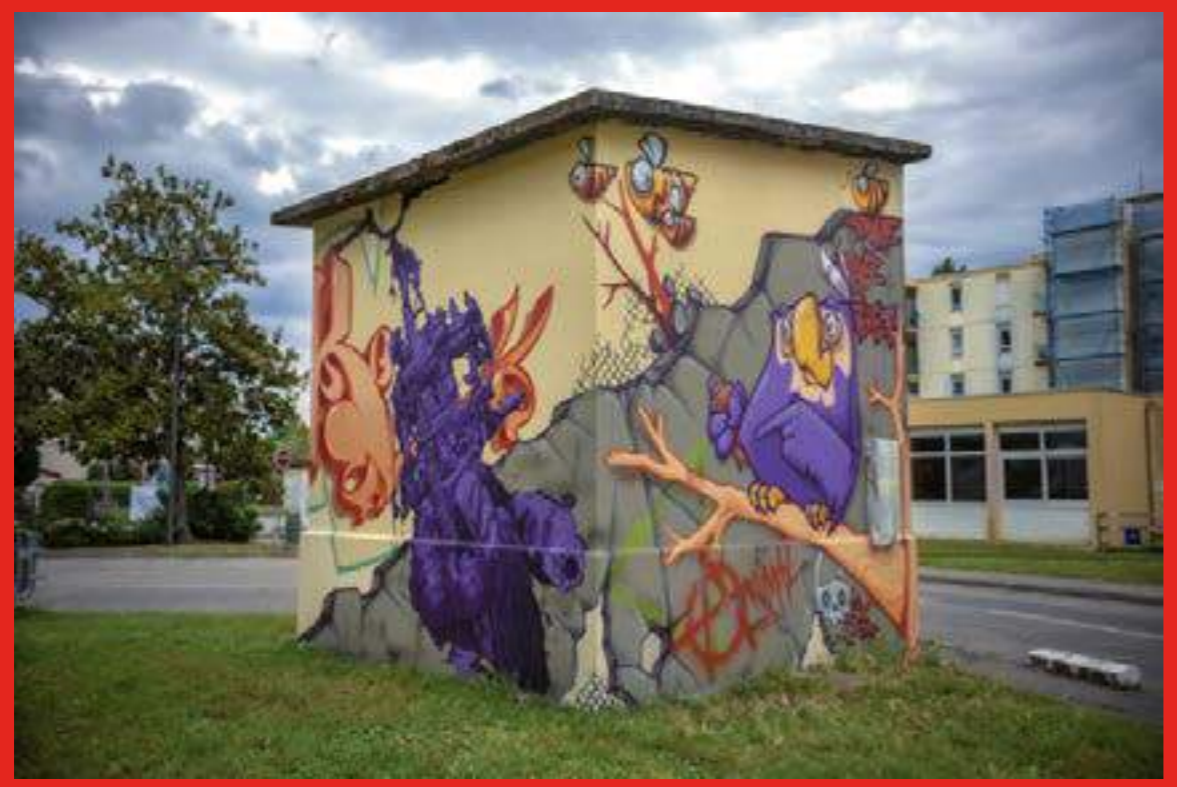
«No future ... ou pas» du Collectif Contratak à la Place Karl Marx, Saint Martin d'Hères.