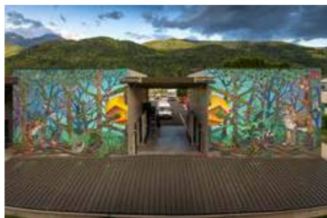
«Natural» de Violant au Impact Environnement. Rue Aristide Berges, Domene