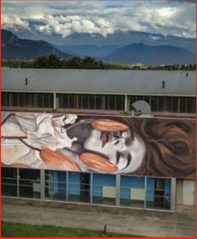
« Ophelie » de Lula Goce sur la Salle Jeannie Longo au 2 rue Pierre de Coubertin, Sassenage