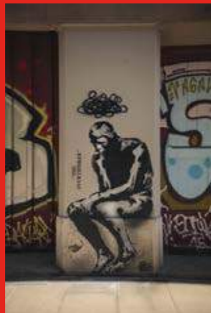
«The Overthinker» au 16 rue Genissieu, Grenoble