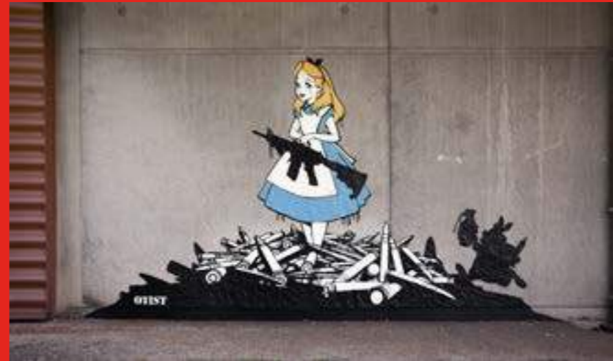
« Alice au Pays des Merveilles #2 » de OTIST au Halle de Sports Jeannie Longo, Sassenage