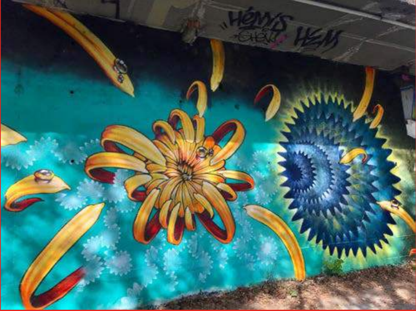
« Improvised quick paint » de Etien' et Hoxxoh, sur les berges de l'Isère.