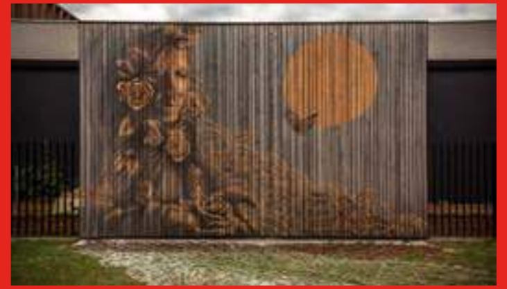
«Chant de roses» de LPVDA & Stina sur la Façade de l'École élémentaire Saint-Exupéry, Pont-de-Claix