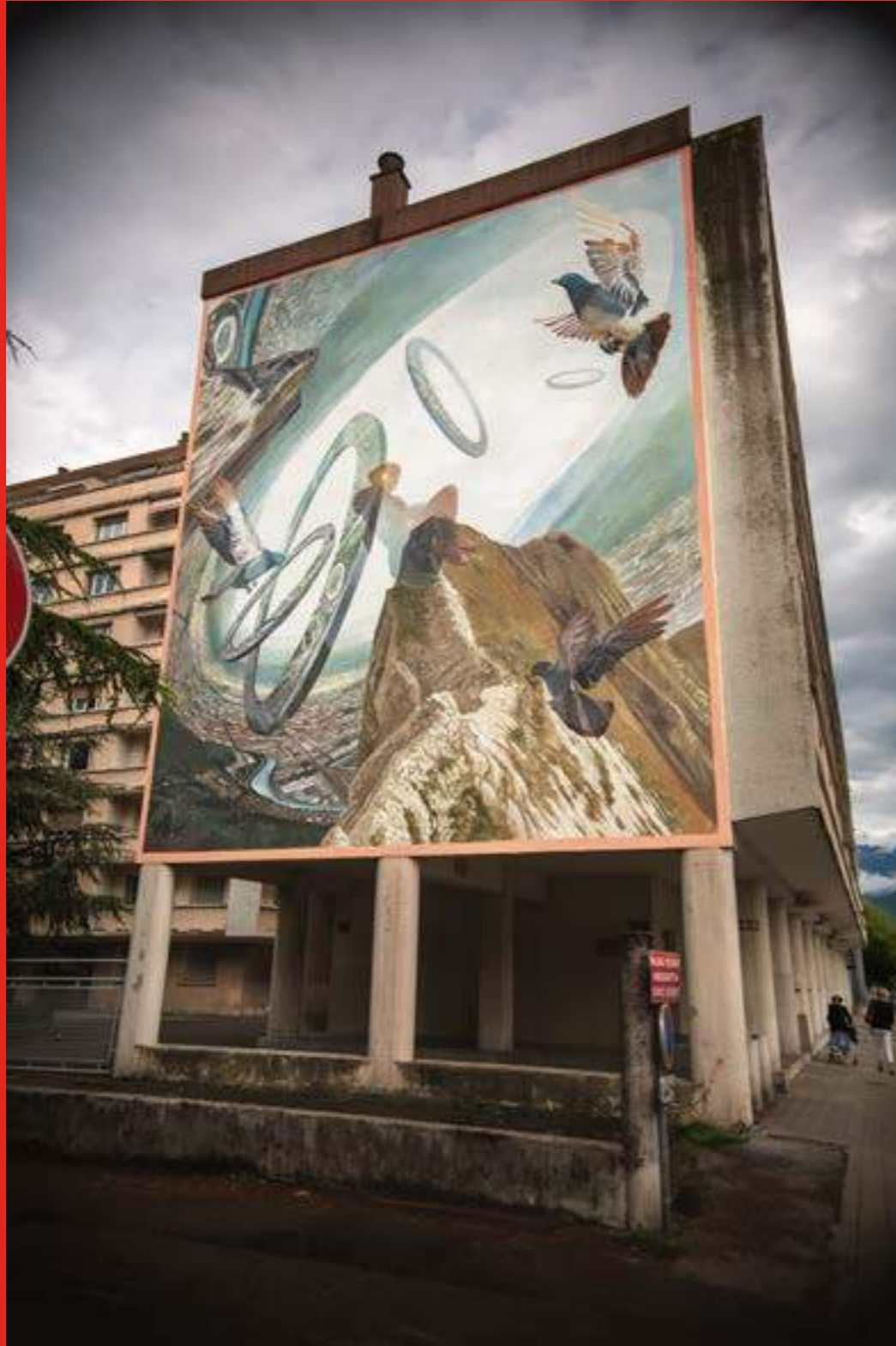
«Sincronie» de Vesod au 16 rue Edouard Vaillant, Grenoble