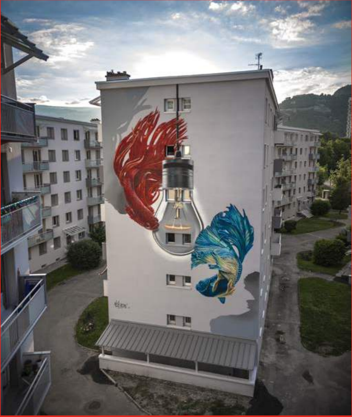
Fresque de Etien' au n°18 résidence Galliéni, boulevard Galliéni, Grenoble