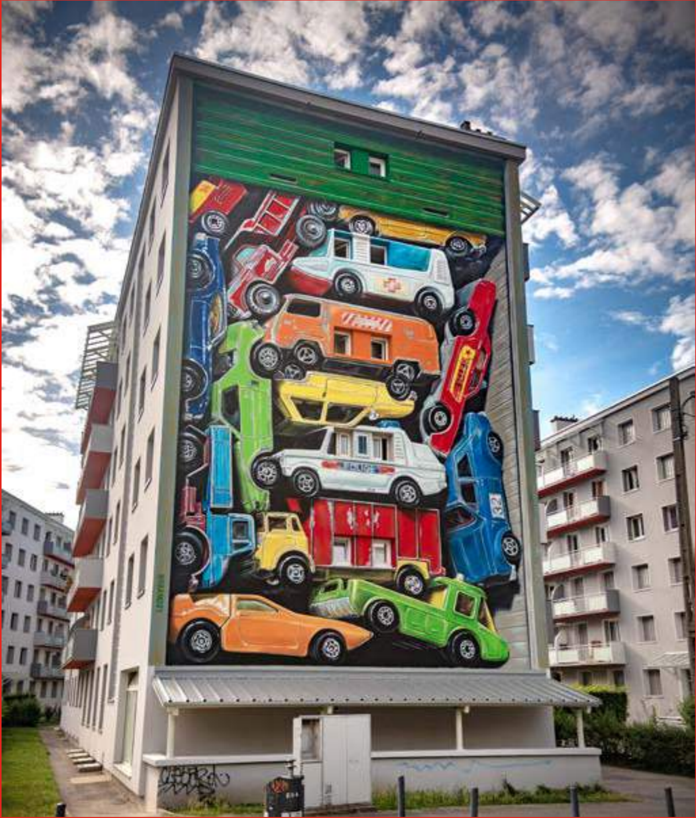
«Re-Collection» de Leon Keer. 16, Residence Galliéni. Boulevard Galliéni, Grenoble