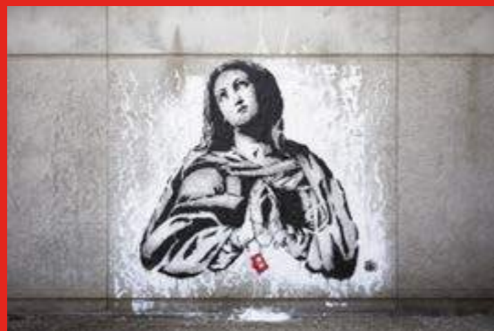
«Saint Algorithm» au Halle Jeannie Longo, Sassenage