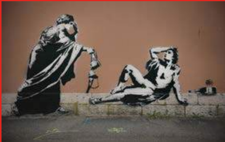
«The afterparty» au Rue Eymard Duvernay, La Tronche