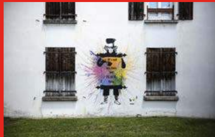
« Is not tea but a peace time » de OTIST 89 au Avenue Jean Jaurès, Eybens