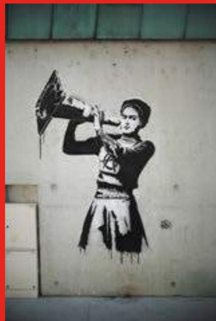
«Your voice is a weapon» à L'espace culturel Odyssee, 89 Avenue Jean Jaurès, Eybens