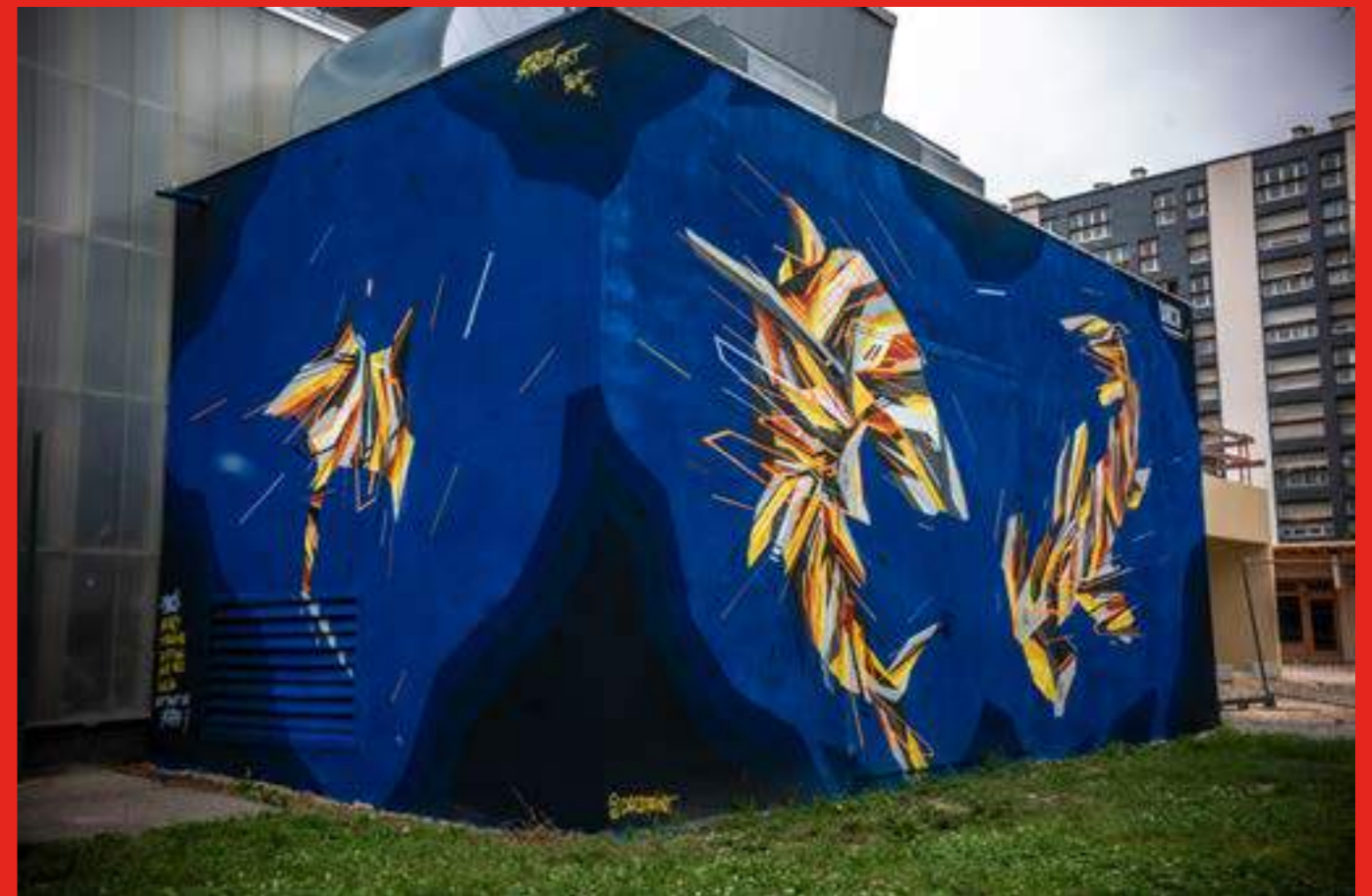
«Graffaine marin» de Daco au 26 avenue Victor Hugo Pont-de-Claix