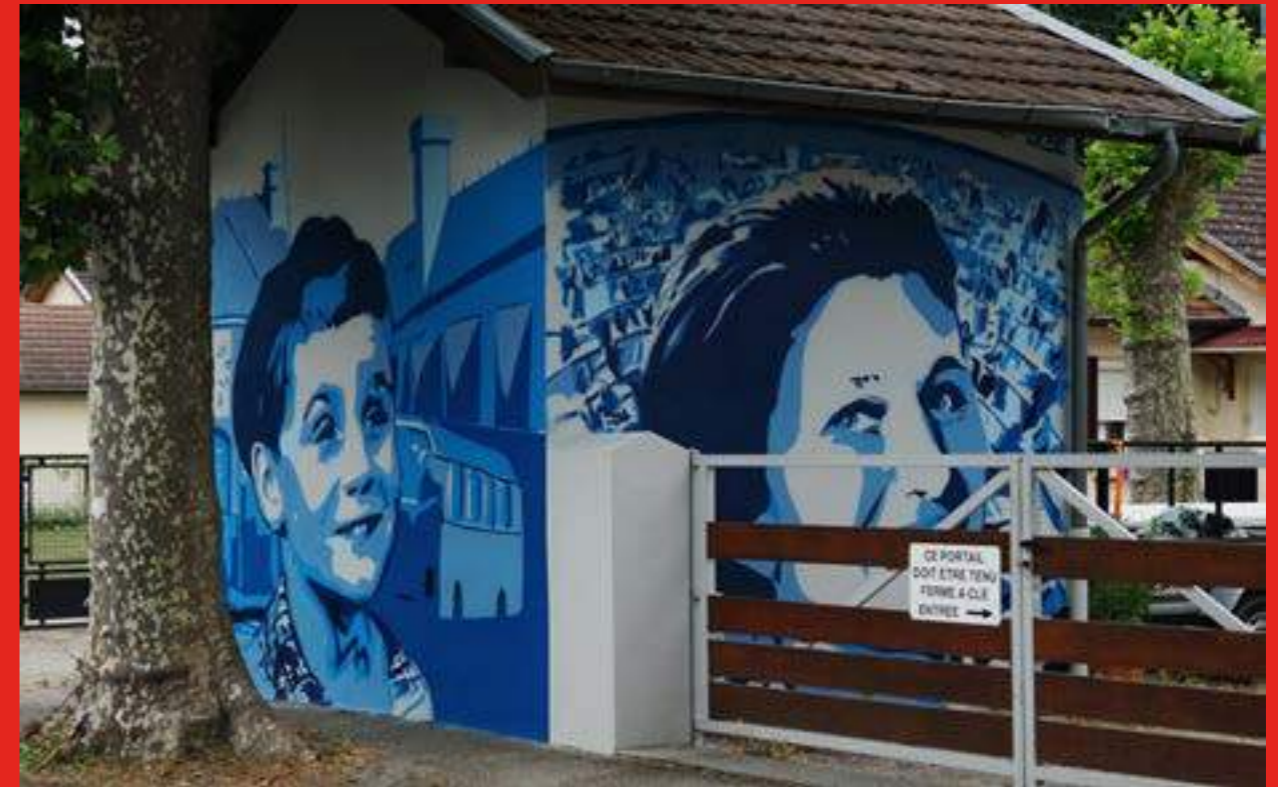
Portrait de «Zazie», «Rosa Parks», «Le petit gibus» et «Simone Veil» de M4U au Espace culturel Navarre, 20 Rue Hector Berlioz, Champ-sur-Drac