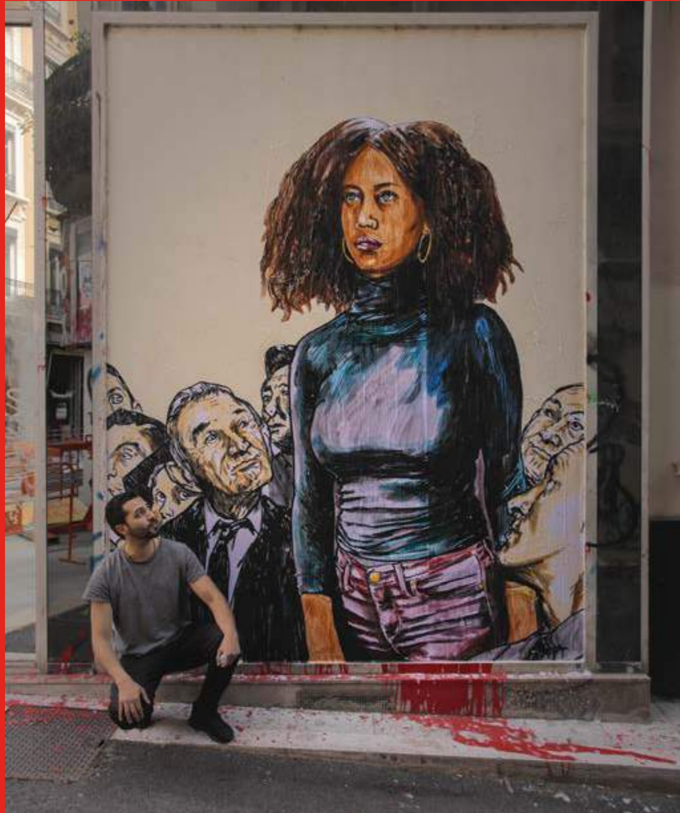
«Freedom for speech» de COMBO. Rue de Phalanstère Grenoble.