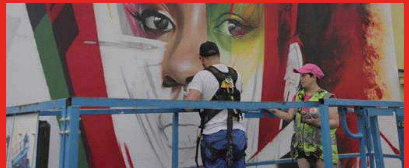
«Ashanti» de Manomatic à l'École Jules Verne, Pont de Claix.