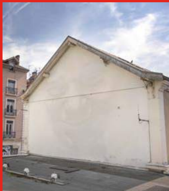
«Magnolia» de Alberto Ruce au 111 Cours Berriat, Grenoble