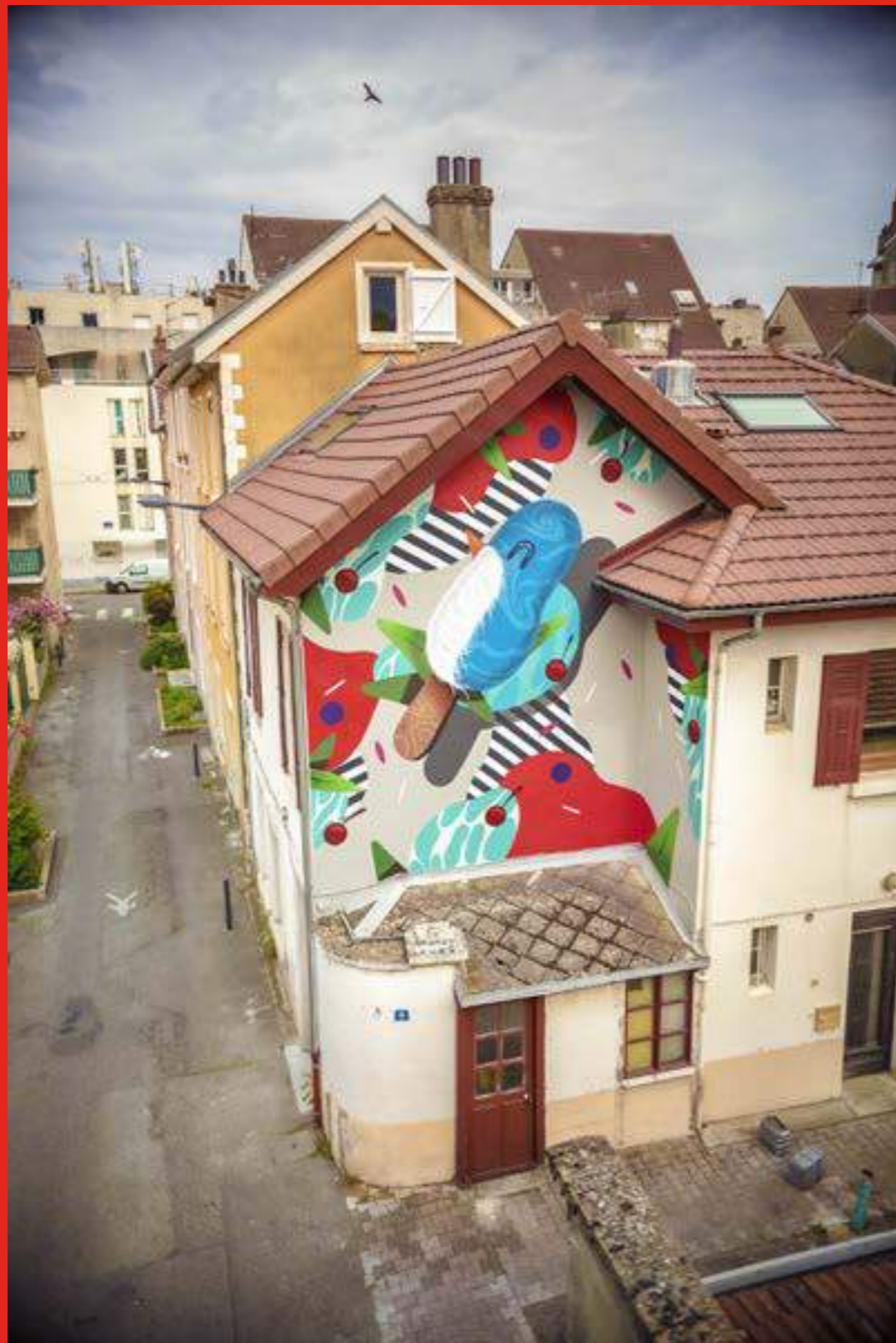
«Le temps des cerises» de Groek au 8 rue Vergniaud, Grenoble