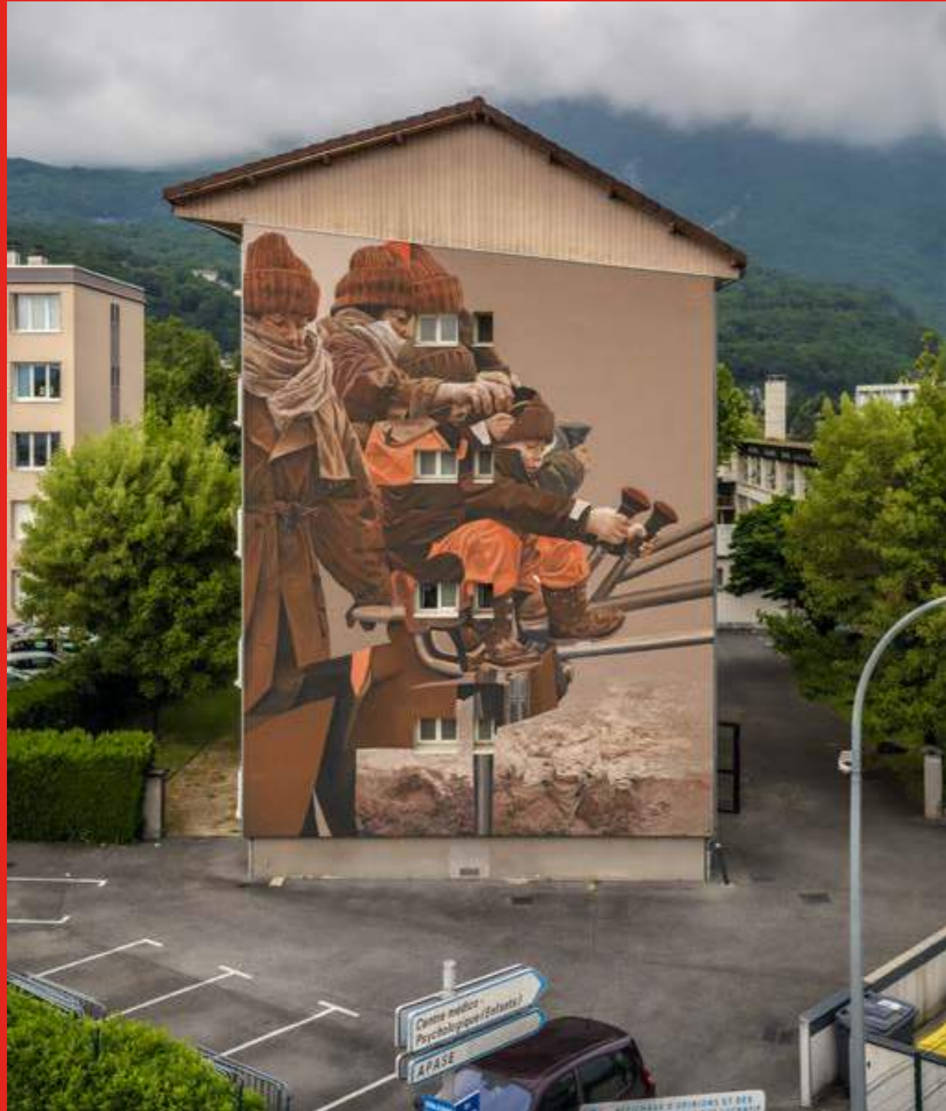
«Taking control» de Miel au 1 rue Paul Eluard, Fontaine