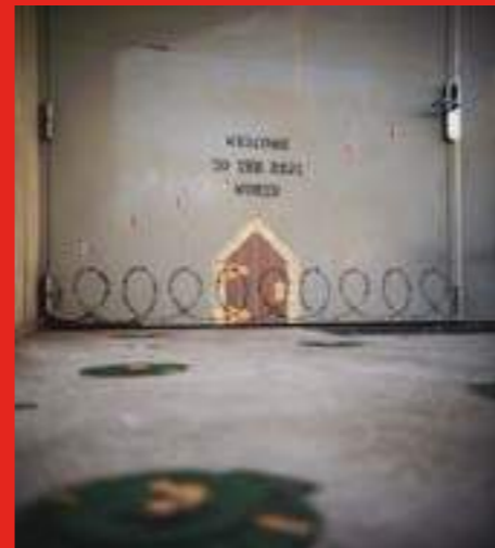
« Alice au Pays des Merveilles #1 » de Otist à la sortie de La Source, Fontaine