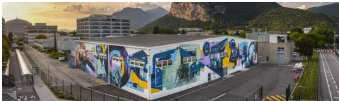
«MacroFusion» de Augustine Kofie & Iota au ST Microelectronics. 12 Rue Jules Horowitz, Grenoble.

Pendant l'édition du Festival 2021, de nombreuses fresques ont été réalisées dans les complexes et sièges de nos partenaires privés.