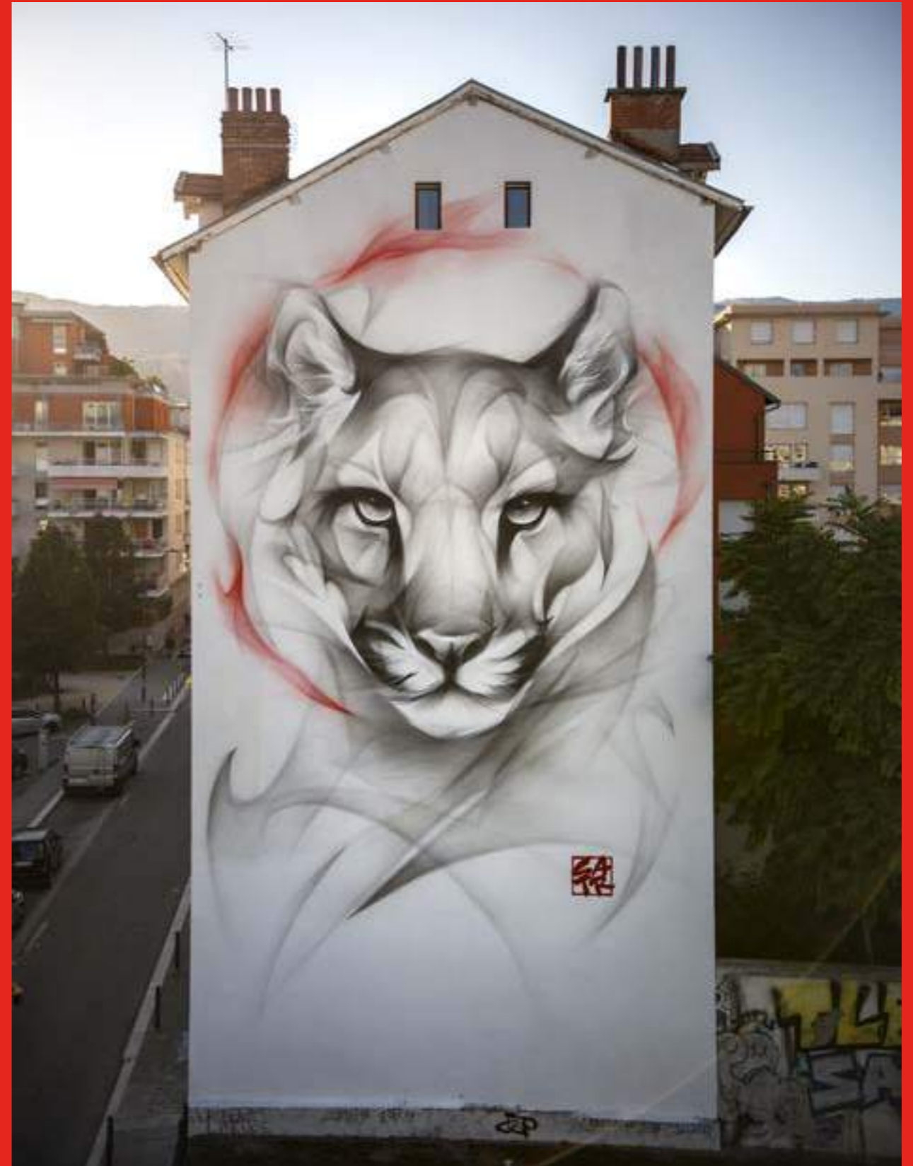
«Ignite Hope» de Satr. 10 rue Dr.Hermite, Grenoble