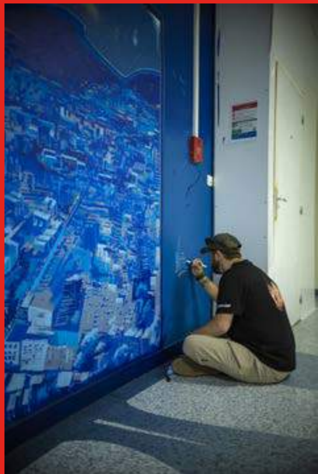
« À cœur ouvert » de Nicolas Keramidas. Intervention à l'intérieur de l'hôpital. Accès entrée Michalon Hôpital CHU Grenoble - Alpes