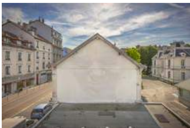
«Magnolia» de Alberto Ruce. Complexe ARaymond, 111 Cours Berriat, Grenoble